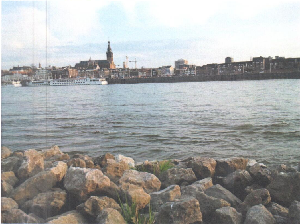
Nijmegen a lenti oldalról.

2011-ben pályáztam Erasmus ösztöndíjra. Évfolyamtársaim ajánlották ezt a lehetőséget. Azt mondták egy vissza nem térő alkalom, külföldi tapasztalatok szerzésére, nyelvtanulásra, kapcsolatok építésére, és egy másik ország, illetve az európai jogrendszer szélesebb körű megismerésére. 2011-12 tavaszi félévét Hollandiában, Nijmegenben töltöttem, ennek köszönhetően. A város gyönyörű! Budapest után kevésbé mozgalmas, de Hollandia legrégebbi városa, 160 ezer lakossal.