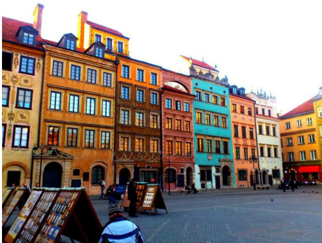
Stare Miasto (Óváros)