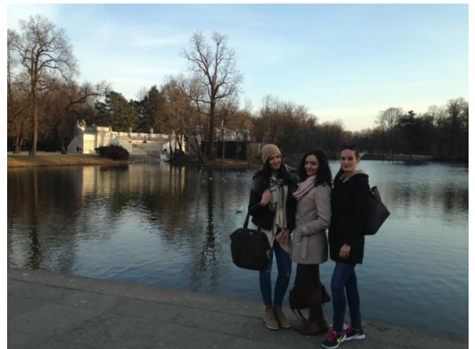
Łazienki Królewskie Park

Aki nem fél a repüléstől, annak mindenképpen javaslom ezt a fajta módját az utazásnak, mert a Wizzair-nek vannak közvetlen járatai, és egész jó akciói, a járatidő pedig csak 1 óra.