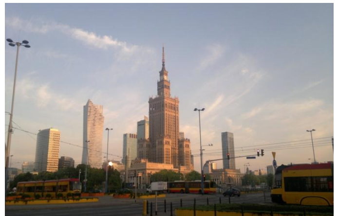
Pałac Kultury i Nauki

Varsó Budapesthez hasonló méretű és népességszámú város, amelyet a Visztula folyó szel ketté. A belváros kissé paradox képet mutat. A szimbólummá vált Pałac Kultury i Nauki szocialista épületét a modern, New York-i látképre emlékeztető kisebb felhőkarcolók veszik körül. Kihagyhatatlan turista célpont az Óváros, amely színes épületeivel elvarázsolja a látogatókat. Ami nekem még nagyon tetszett, hogy a város tele van parkokkal, ahol friss(ebb) levegőt szívhatunk, piknikezhetünk, sportolhatunk, vagy akár mókusokat etethetünk.