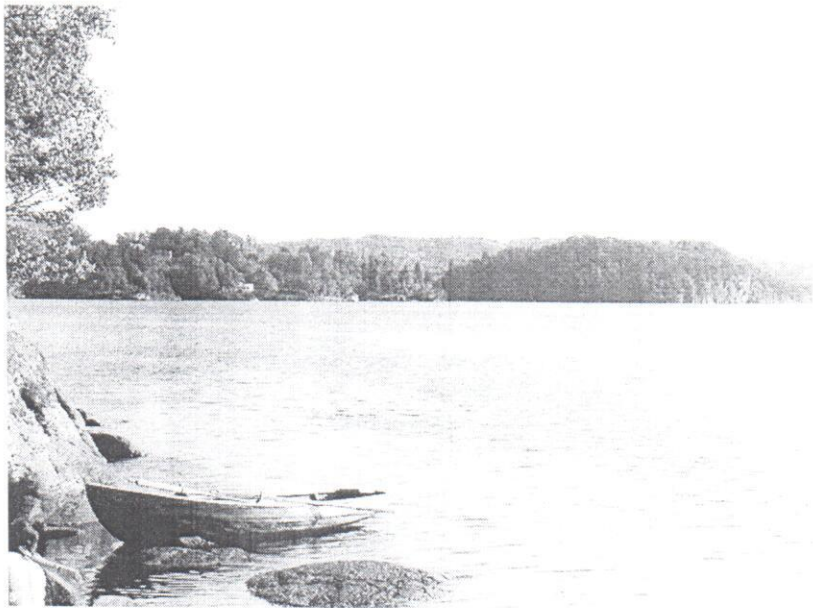
A fjord a Lidl mellett