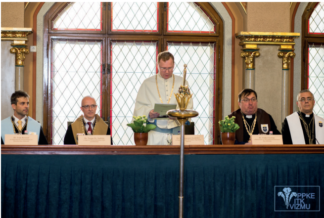
Egyetemi tanévnyitó ünnepség