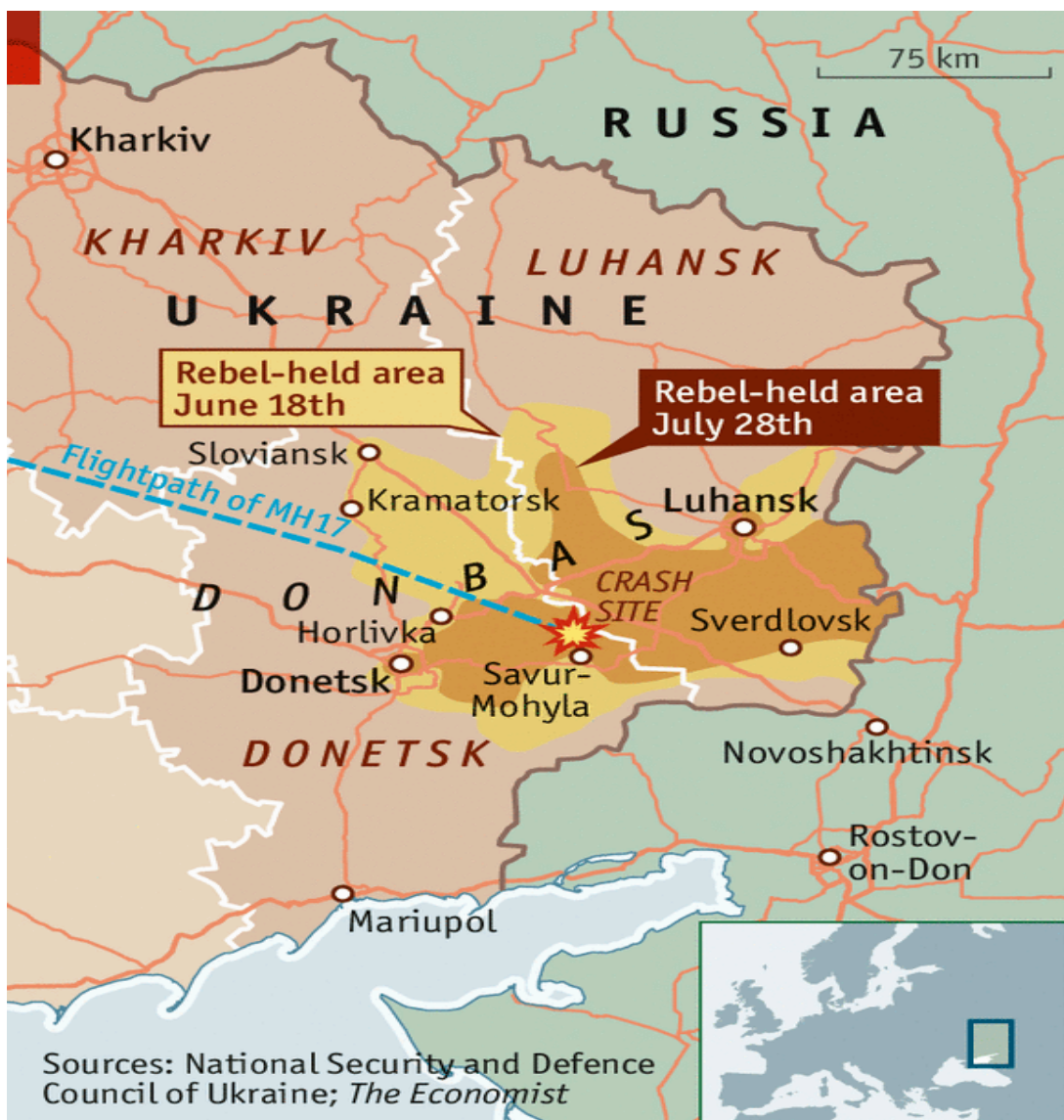
Az MH-17 tragédiájának helyszíne 450